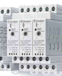
Série 15 Dimmers