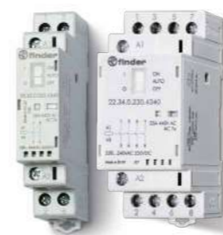
Série 22 Contator modular

Automações para áreas comuns e de relaxamento Série 15 / 22 / 78 / 84