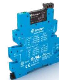
Série 39 Relé modular de interface, 6.2 mm