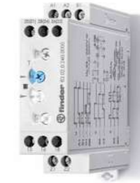
Série 83 Temporizador modular, 22.5 mm