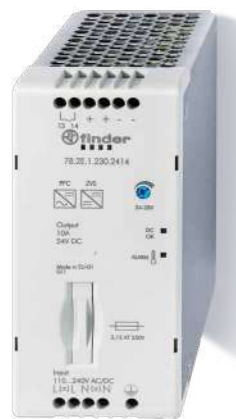
Série 78 Fontes chaveadas