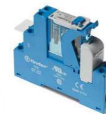
Série 4C Relé modular de interface, 15.8 mm