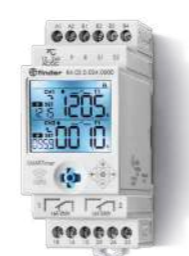
Série 84 SMARTimer