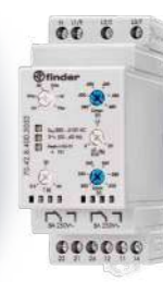
Série 70 Relés de monitoramento