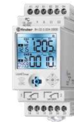
Série 84 SMARTimer