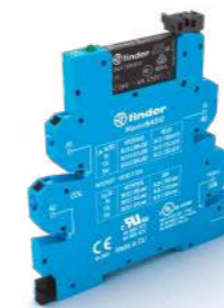
Série 39 Relé modular de interface, 6.2 mm