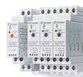
Série 15 Dimmers