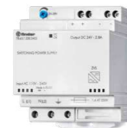
Série 78 Fontes chaveadas