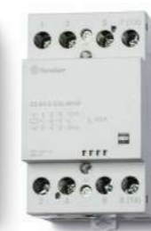
Tipo 72.42 Relé para alternância de cargas