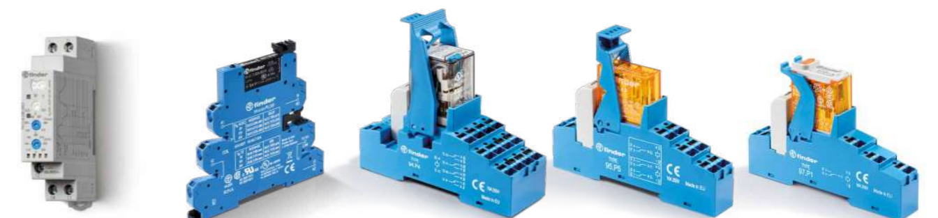
Série 70 Relés de monitoramento