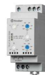
Série 70 Relés de monitoramento