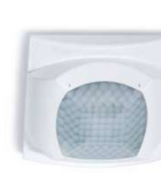
Série 18 Sensor de movimento