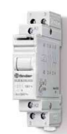
Série 20 Relé de impulso modular