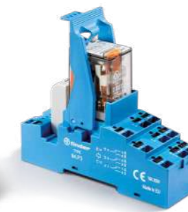
Série 58 Relé modular de interface, 27 mm