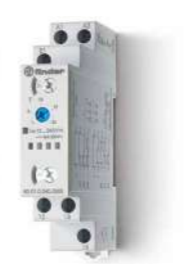
Série 80 Temporizador modular, 17.5 mm