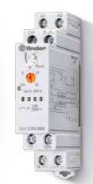
Série 13 Relé de impulso eletrônico