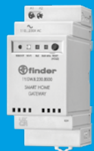
1Y.GW.8.230.BS00 SMART HOME GATEWAY