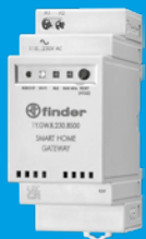
1Y.GW.8.230.BS00 SMART HOME GATEWAY