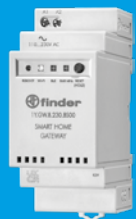
1Y.GW.8.230.BS00 SMART HOME GATEWAY