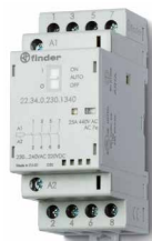
Serie 22 Installationsschütze