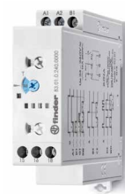
Serie 83 Zeitrelais