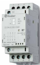
Serie 22 Installationsschütze