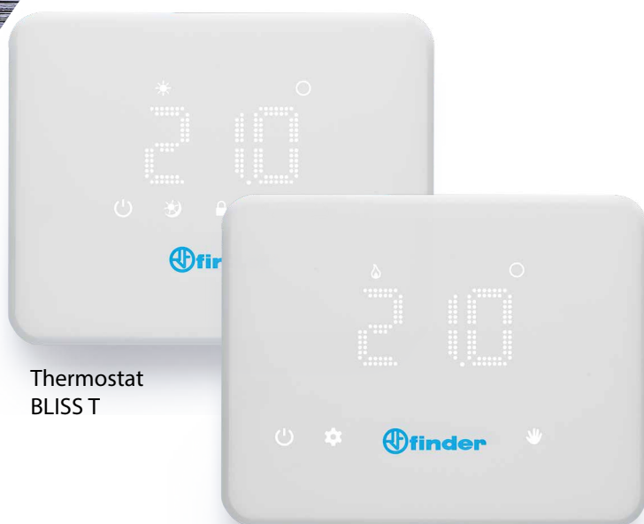
Thermostat BLISS T