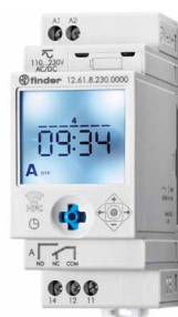
1 Wechsler 16 A Typ 12.61.8.230.0000 110...230 V AC/DC

Anwendungen: Kommunale Beleuchtung (Straßen, Plätze, Denkmäler, Brunnen...) Gärten, Parkplätze, Geschäfte, Leuchtschilder, Bewässerungssysteme, Heiz- und Kühlanlagen.