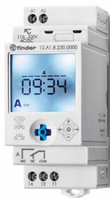
1 Wechsler 16 A Typ 12.A1.8.230.0000 110...230 V AC/DC