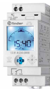
1 Wechsler 16 A Typ 12.81.8.230.0000 110...230 V AC/DC

Anwendungen: für eine Vielzahl von Anwendungen wie Heizung, Beleuchtung und Bewässerung geeignet...