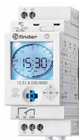
1 Wechsler 16 A Typ 12.51.8.230.0000 110...230 V AC/DC