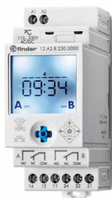
2 Wechsler 16 A Typ 12.A2.8.230.0000 110...230 V AC/DC