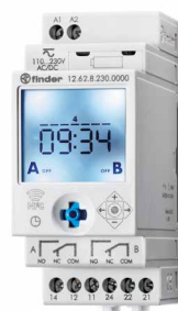
2 Wechsler 16 A Typ 12.62.8.230.0000 110...230 V AC/DC