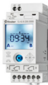
Tipo 12.A2.8.230.0000 2 reversíveis 16 A 110...230 V AC/DC