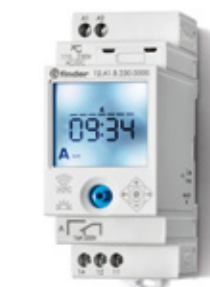
Tipo 12.A1.8.230.0000 1 reversível 16 A 110...230 V AC/DC

Iluminação pública (ruas, praças, monumentos, fontes, ...) jardins, estacionamentos, vitrines, outdoors, sistemas de irrigação e sistemas de aquecimento ou refrigeração.