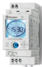
Tipo 12.51.8.230.0000 1 reversível 16 A 110...230 V AC/DC

Apto para diversos tipos de aplicação, como aquecimento, iluminação, irrigação...