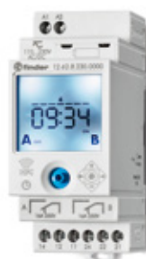
Tipo 12.62.8.230.0000 2 reversíveis 16 A 110...230 V AC/DC