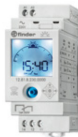
Tipo 12.81.8.230.0000 1 reversível 16 A 110...230 V AC/DC