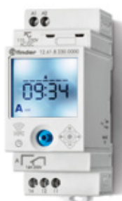
Tipo 12.61.8.230.0000 1 reversível 16 A 110...230 V AC/DC

Sistemas de irrigação, sistemas de aquecimento ou refrigeração, vitrines, outdoors e abertura de cancelas.